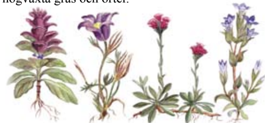
Blåsluga Backsippa Kattfot Fältgentiana "av hävd" = att något har lång tradition av att användas/utnyttjas i ett speciellt sammanhang.

Många gravfält i odlingslandskapet har under århundraden, kanske under tusen år hävdats av traktens jordbrukare för slåtter och bete. Ängs- och hagmarksfloran är därför ett levande kulturminne som fordrar fortsatt hävd för att överleva. Slåtter och bete har gynnat de växter som klarat hårt betestryck eftersom de har bladrosetter vid marken som överlever. Om hävden upphör blir de lätt utkonkurrerade av högväxta gräs och örter.